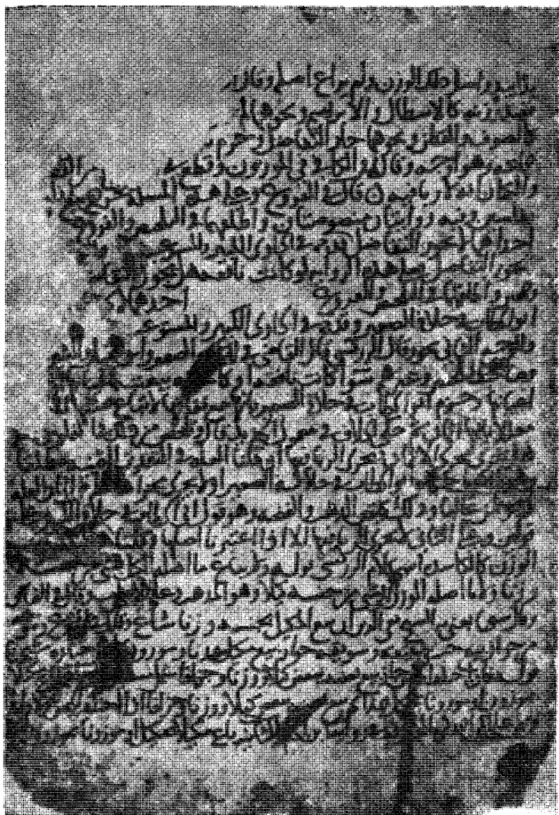
أول صفحة من الموجود من الجزء الثالث بخط المؤلف وهي الصفحة الثالثة من أول الجزء